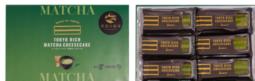
トーキョーリッチ・抹茶チーズケーキ 6 本入