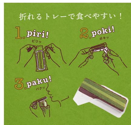
東京ぼーの お召し上がり方 3step